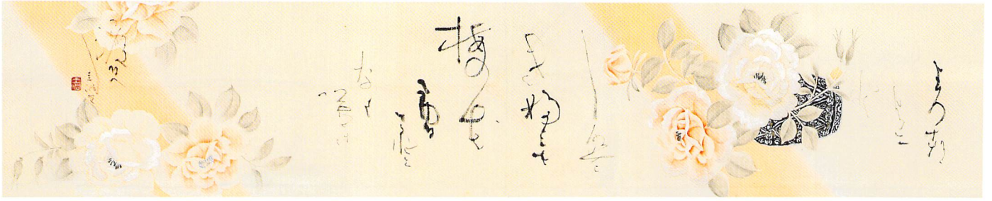
花 萬代に年は來經とも梅の花絶ゆることなく咲き渡るべし (筑前介佐氏子首)